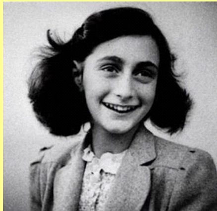
Anne Frank (1929-1945)

Treptow-Köpenick (Gymnasium in Altglienicke)