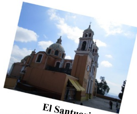
El Santuario de la Virgen de los Remedios encima de la pirámide