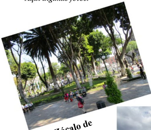
El Zócalo de Puebla