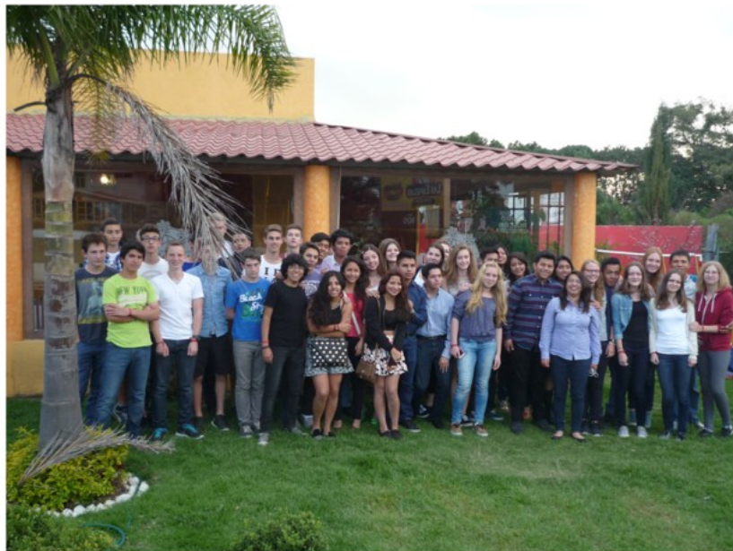
El grupo delante del restaurante „Las Espuelas“