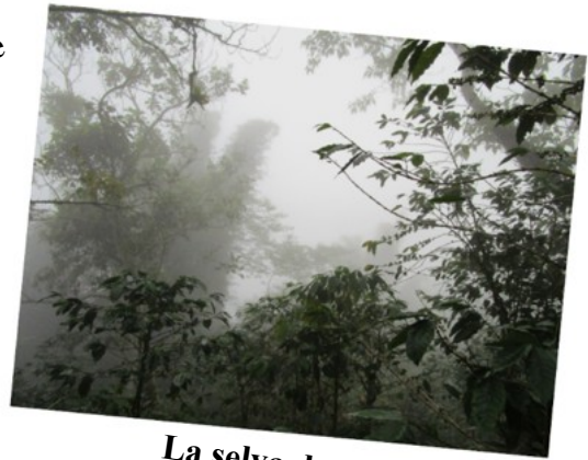
La selva de Cuetzalán