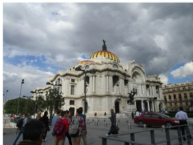
El Palacio de Bellas Artes de México D.F.