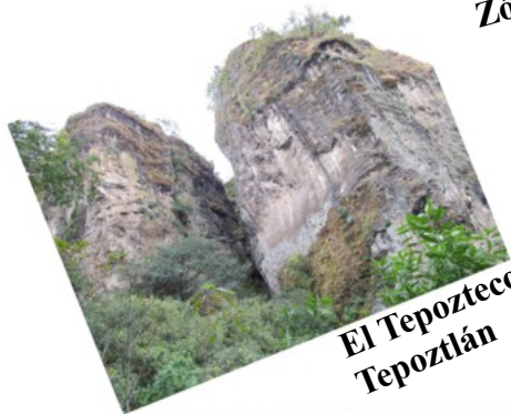
El Tepozteco en Tepoztlán